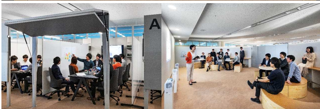
(スクラムチームの様子)